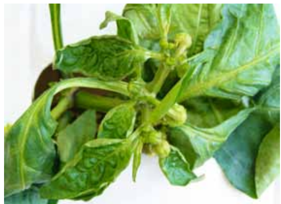
Slika 4. P. latus : simptomi na paprici (3)