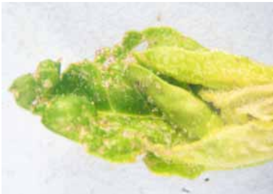
Slika 6. T. similis : simptomi na spanaću (1)