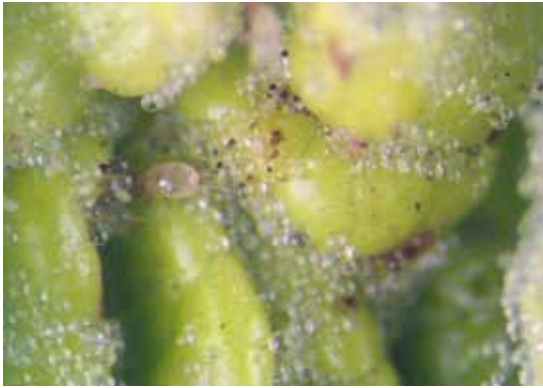
Slika 5. Tyrophagus similis Volgin na spanaću