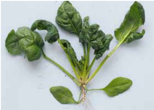
Slika 7. T. similis : simptomi na spanaću (2)

Posebno treba istaći da se na reproduktivnom materijalu u prometu, koji je podvrgnut fitosanitarnoj kontroli, na arpadžiku redovno sreće eriofida lukovičastih biljaka A. tulipae . Pošto jaka infestacija dovodi do sušenja lukovica poznata je i pod nazivom grinja sušenja lukovica (Slike 8 i 9). Ova eriofida se pojavljuje u EPPo regionu i u EU, a od 2006. je otkrivena i u Velikoj Britaniji, na arpadžiku poreklom iz Holandije, zbog če-