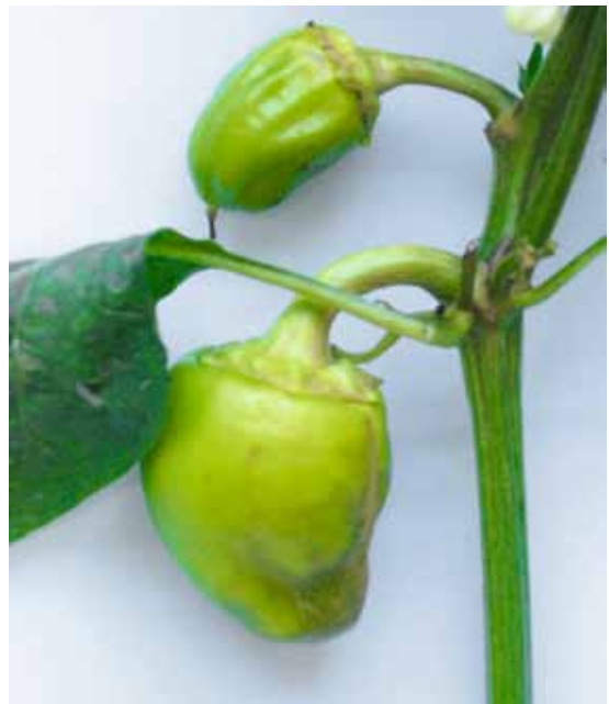
Slika 3. P. latus : simptomi na paprici (2)

Pored nabrojanih vrsta, u zaštićenom prostoru se kao štetočine cveća ističu i pljosnate grinje Brevipalpus obovatus Donnadieu i Tenuipalpus pacificus Baker, tarzone-mide Phytonemus pallidus (Banks) i Steneotarsonemus