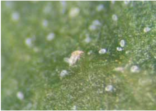
Slika 1. Kolonija Polyphagotarsonemus latus (Banks)