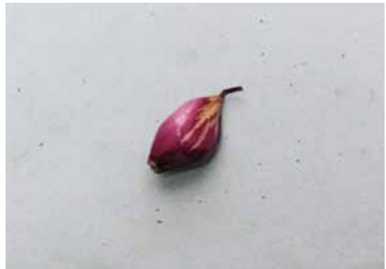
Slika 9. A. tulipae : simptomi na lukovicama