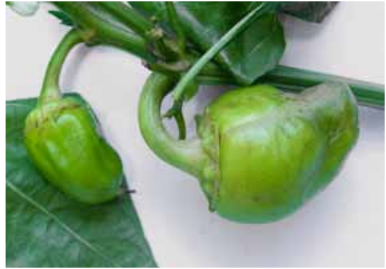
Slika 2. P. latus : simptomi na paprici (1)