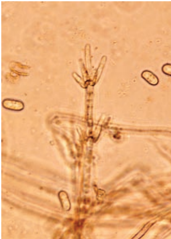
Slika 4. Izgled konidiofore Cladobotryum dendroides

le, poreklom iz Evrope, Australije, Severne Amerike, divergentniji i imaju tendenciju grupisanja prema geografskom poreklu. Pretpostavlja se da su izolati C. mycophilum iz Republike Irske, odgovorni za pojavu paučinaste plesni u epidemiološkim razmerama, poreklom iz istog gajilišta. Britanski rezistentni izolati pokazuju izvesnu varijaciju u odnosu na njih, što ukazuje da su možda nastali nezavisno. Izolati rezistentni na benzimidazole nisu nađeni van Irske i Velike Britanije.