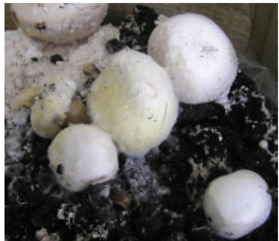
Slika 2. Micelija gljive Cladobotryum dendroides na plodonosnim telima Agaricus bisporus nakon prirodne zaraze (kasni simptomi)