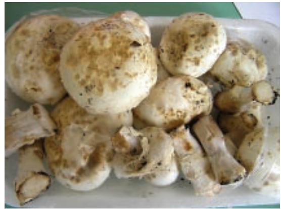
Slika 1. Smeđe mrlje na plodonosnim telima Agaricus bisporus nakon prirodne zaraze gljivom Cladobotryum dendroides (rani simptomi)

Cladobotryum spp. obrazuje belu, paučinastu, vazdušnu miceliju neravnog oboda na KDA hranljivoj podlozi, pri sobnoj temperaturi. Vremenom micelija menja boju u žutu, a kasnije postaje ružičasta ili crvena. Hife su prozirne, septirane, položene, sa 3-4 uspravne i pršljenasto ili nepravilno granate konidiofore, pa otuda potiče i ime roda – Dactylium , od grčke reči daktylos – prst. Konidiofore su prozirne, jednostavne, uzdižu se sa vaz-