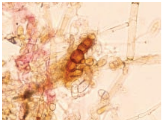
Slika 7. Hlamidospore gljive Cladobotryum dendroides