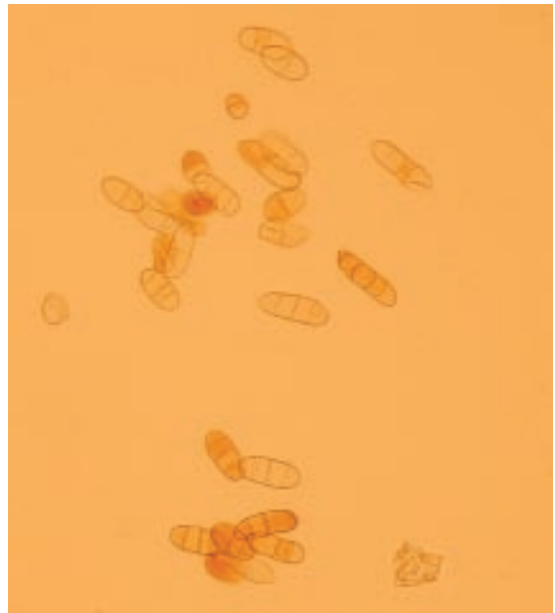
Slika 5. Izgled konidija Cladobotryum dendroides sa jednom do tri septe

Pretpostavlja se da patogen Cladobotryum spp. preživljava u vidu mikrosklerocija u sirovom materijalu koji se koristi za spravljanje pokrivke. Izvori Cladobotryum spp. mogu biti u bližoj ili daljoj okolini gajilišta: u zemlji, na mahovini, mrtvom drvetu ili divljim gljivama (Desrumeaux, 2005). Simptomi paučinaste plesni, nakon inokulacije sporama Cladobotryum spp., obično se javljaju tokom poslednjih talasa plodonošenja (trećeg ili četvrtog). Međutim, širenje paučinaste plesni micelijom Cladobotryum spp. dovodi do rapidnog razvoja simpto-