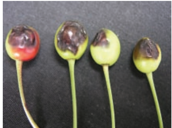
Slika 2. Nekroza plodova višnje

Plamenjača mladara, listova i cvasti maline, prouzrokovana bakterijom P. syringae , se poslednjih godina sve češće uočava u centrima gajenja ove voćke, područjima Arilja i Ivanjice u jugozapadnoj Srbiji. Početni simpto-