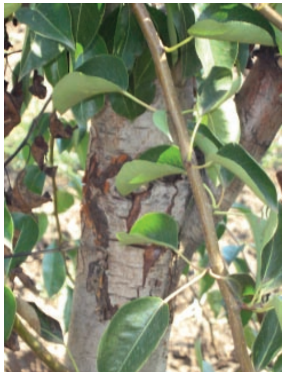
Slika 1. Nekroza višegodišnjih grana i debla kruške

Nekroza višegodišnjih grana i debla identična onima na krušci zapažena je i na stablima jabuke ali u mnogo manjem intenzitetu, dok palež cvasti jabuke do sada nije primećen kod nas (Gavrilović, 2006; Gavrilović i sar., 2008a).