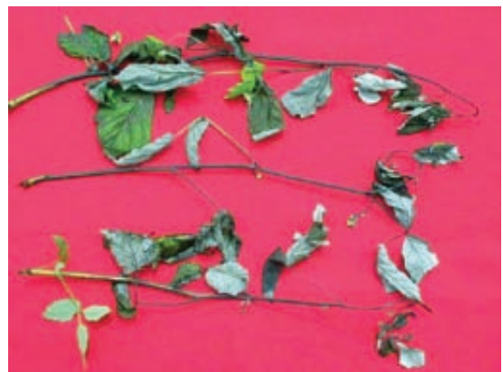
Slika 3. Simptomi plamenjače na malini